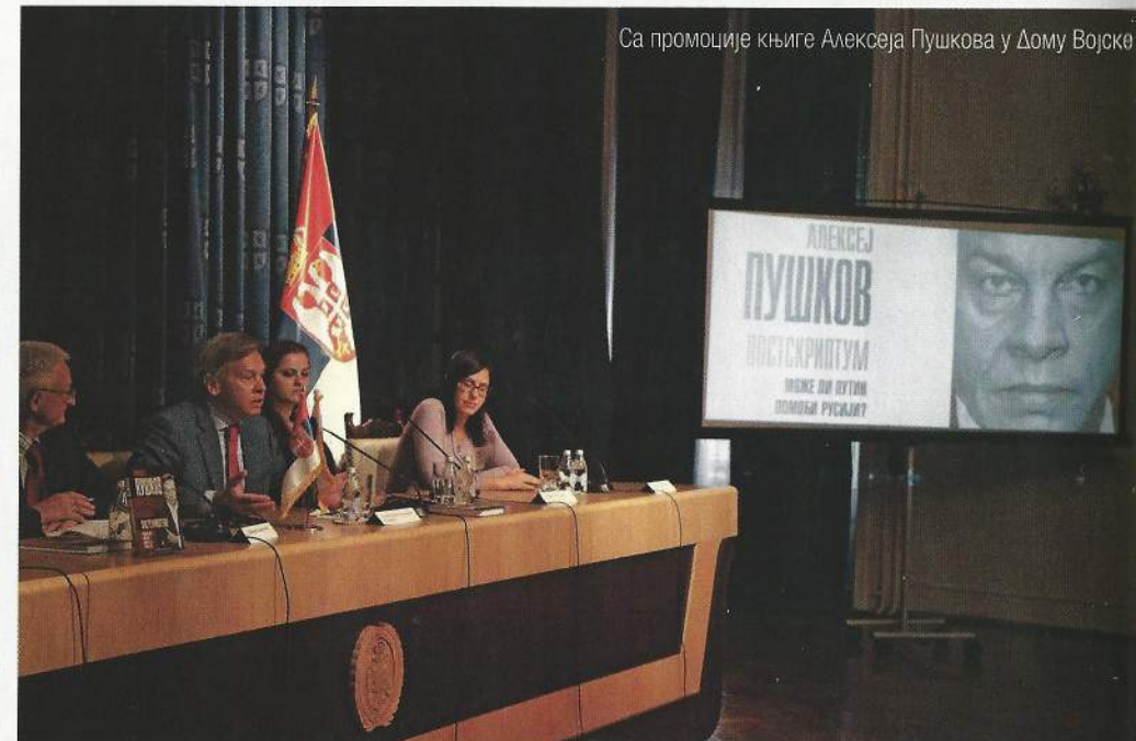
Са промоције књиге Алексеја Пушкова у Дому Војске

С обзиром на то да сте рекли да Америка више није светски лидер, сматрате ли да би Русија могла да јој буде озбиљан конкурент, који, при томе, има идејни систем вредности који треба да буде алтернатива америчкој цивилизацији?