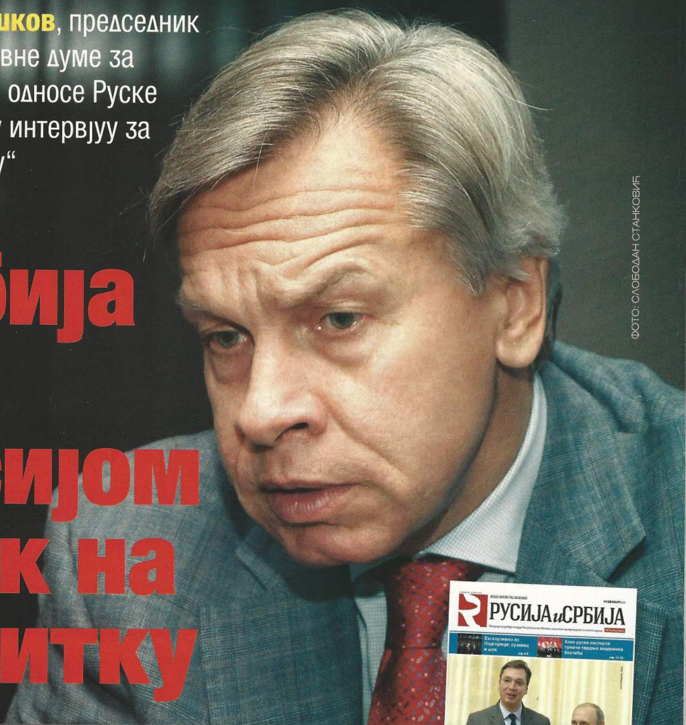
ФОТО: СЛОБОДАН СТАНКОВИЋ